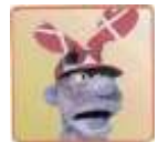
😊 STOKE 😊

1. Runde: STOKE (1) – LIVPOOL (2): (3 – 2, 10 – 9)