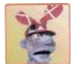
😊 FOREST 😊

1. Runde: FOREST (2) – FLINCA (1): (3 – 3, 10 – 10, 7 – 7, 6 – 6, 6 – 7, 8 – 6, 8 – 8)