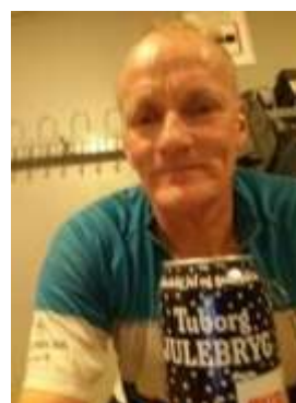
😊 AGGER 😊