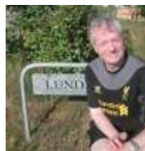
Sergio / Zico