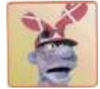
😊 COTTEE 😊

1. Runde: STEAM (3) – COTTEE (2) : (1 – 2, 6 – 11)