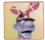
😊 ANDERUP 😊

1. Runde: KUDSKEN (3) – ANDERUP (2) : (2 – 3, 8 – 9)