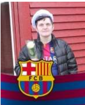
😊 BARCA 😊

😊 LUND er sidste oversidder og LUND har hidtil opnået en 3. plads i Pokalen i 1999, så nu er der lagt op til at komme på den prestigefulde Pokal Top 3 – Evighedstabel igen 😊