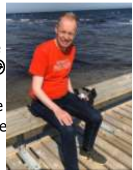
🕶️ Fox 🕶️