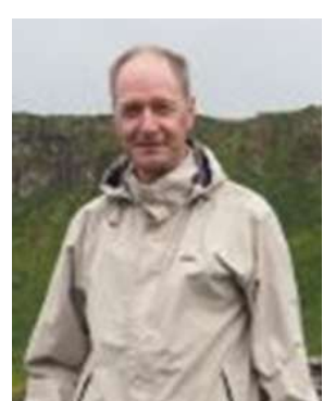
😊 LUND 😊