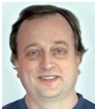
😊 ARSENAL 😊