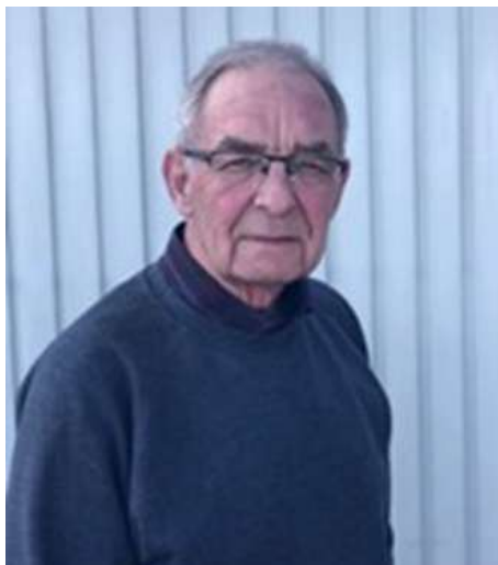
🙄 BRULA 🙄

1. Runde: BRULA (3) – WATSON (2) : (1 – 3, 7 – 9)