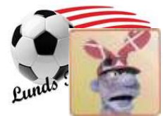
😊 SPVK 😊

1. Runde: CORK (1) – SPVK (2) : (3 – 3, 11 – 10, 7 – 8, 6 – 7)