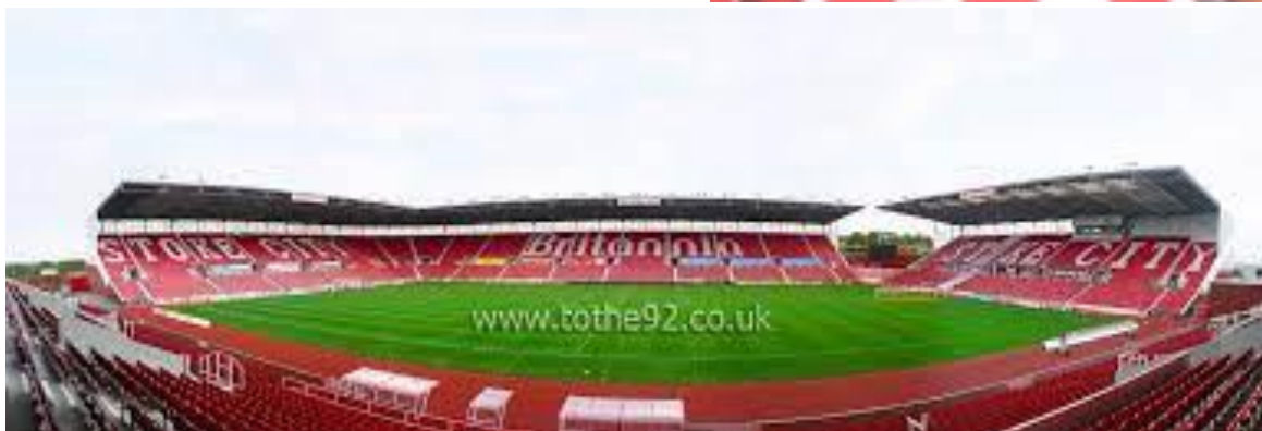
Bet365 Stadium/Stoke City FC