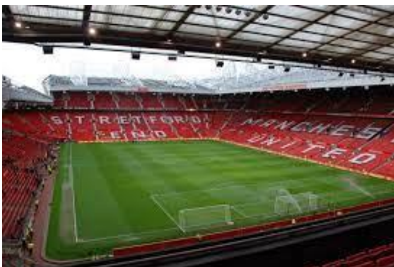
Old Trafford – Manch. United