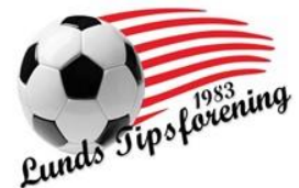
🙇 MORAN 🙇

1. Runde: PERCY (2) – MORAN (3): (4 – 7)