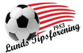
😊 NANDO 😊

1. Runde: VINDING (2) – NANDO (2): (6 – 6, 5 – 6)