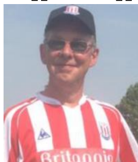
👤 Stoke 👤