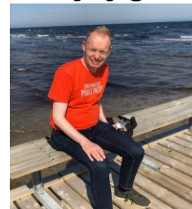
👤 Fox 👤