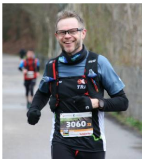
👤 Nielsen 👤