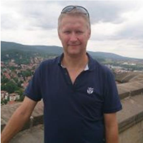
😊 KINKS 😊

EN AF DISSE TIPPERE BLIVER G.P.-MESTER 2024 😊