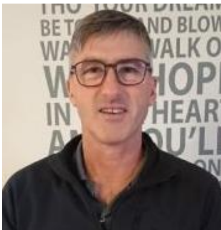
😊 IDSKOV 😊