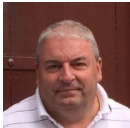
😊 NUSER 😊