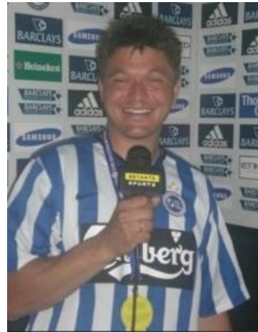
😊 ANDERUP 😊