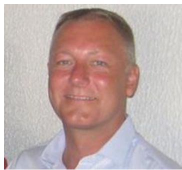
😊 HØJGÅRD 😊