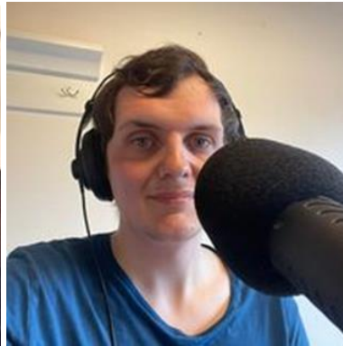
😄 CHELSEA 😄