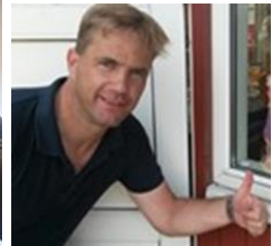
😄 TYNDE 😄