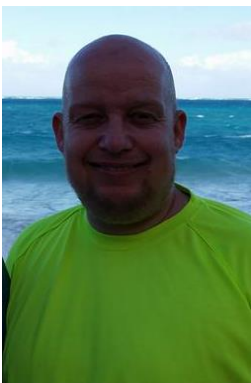
😄 KAILUA 😄