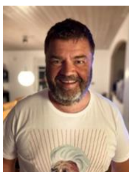
😊 BORRIS 😊