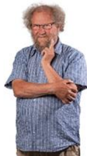
😊 STEAM 😊