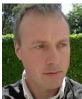
😊 FAR 😊