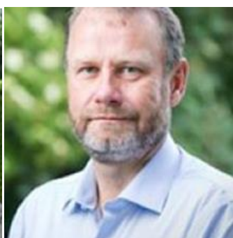
😊 SELECT 😊