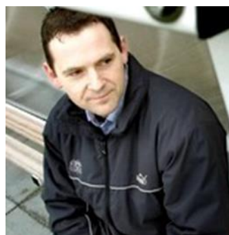
😊 MOON 😊