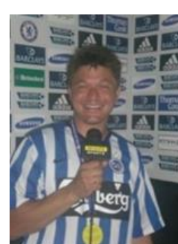
😊 ANDERUP 😊