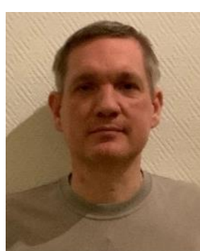
😊 AMIGO 😊