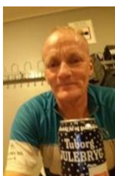
😊 AGGER 😊