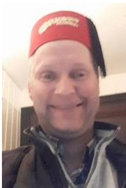
😄 FOREST 😄