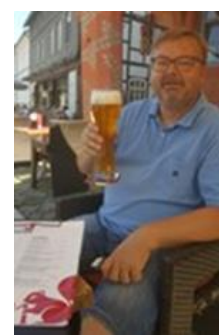
😊 HEDE 😊