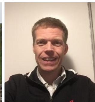
😊 NORWICH 😊