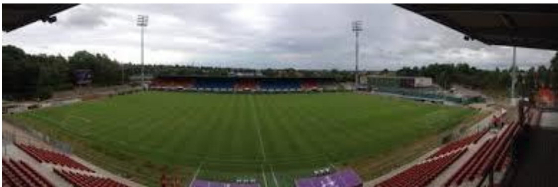
Harboe Arena – Slagelse