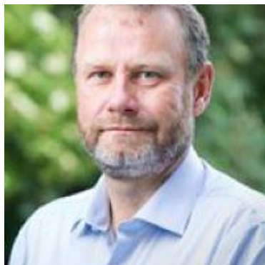
😊 SELECT 😊