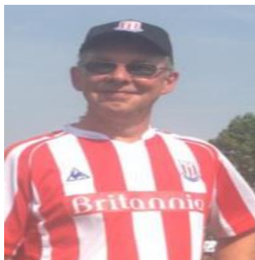
😊 STOKE 😊