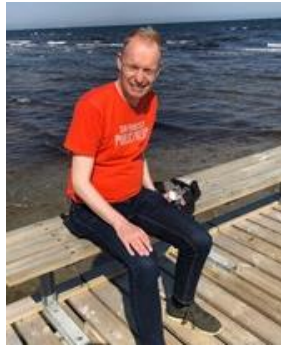
😊 FOX 😊