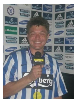
😞 ANDERUP 😞