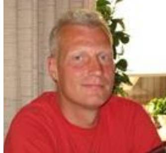
😞 SCHØN 😞