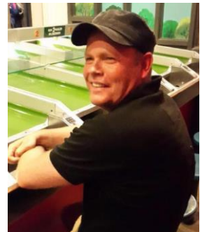
😞 ANFIELD 😞

😞 COTTEE fra 3. Ligas øvre halvdel, lå før sidste kamp over stregen og havde det ene ben i Semifinalerunden, men det afsluttende uafgjorte resultat mod HARRY blev skæbnes-vangert for COTTEE , der hermed kom ud i en fintællingskamp og her blev COTTEE den store taber og dumpede ned under stregen og hermed er Liga Cup'en forbi for COTTEE 😞 HARRY fra bunden af 1. Liga, skulle vinde den sidste kamp, for at have chancen for at ryge over stregen, men det blev kun til uafgjort mod COTTEE , så hermed sluttede Liga Cup 2024 for HARRY 😞 STEAM fra topfeltet i Ligaens 3. division, var med tre uafgjorte kampe, sat af inden den sidste kamp, så Liga Cup'en er hermed forbi for STEAM 😞 ANFIELD også fra toppen af Ligaens 3. division, opnåede også kun tre uafgjorte resultater, så ANFIELD kunne ikke være med her og Liga Cup 2024 er forbi for ANFIELD 😞