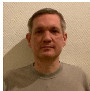
😞 AMIGO 😞

😞 BORRIS fra bunden af 3. Liga, havde en teoretisk chance for at nå over stregen inden den sidste kamp og BORRIS gjorde hvad han kunne og sluttede af med en sejr over AMIGO, men alligevel blev BORRIS hængende lige under stregen, så Liga Cup 'en er forbi 😞 ZICO fra midterlinjen i Ligaens 2. division blev Liga Cup Mester i 2010 og igen i sidste sæson, så ZICO er forsvarende Liga Cup Mester og alt så godt ud med ZICO lige over stregen inden den sidste kamp, men et afsluttende forsmædeligt nederlag mod STOKE blev skæbnesvangert og ZICO blev overraskende skubbet ud af turneringen 😞 FRYDKÆR fra toppen af 2. Liga ville med en afsluttende sejr, have gode muligheder for at rykke over stregen, men FRYDKÆR nr. 3 i 2015, kunne kun hive uafgjort ud af den afsluttende kamp mod MCCOIST og så var det sket, - FRYDKÆR er færdig i Liga Cup 2024 😞 AMIGO fra nedre felt i den bedste Liga-række, ville med en afsluttende sejr mod BORRIS have muligheden for at slutte over stregen, men det lykkedes ikke, idet AMIGO måtte indkassere et afsluttende nederlag og så sluttede Liga Cup 'en for denne gang for AMIGO 😞