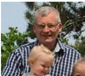
😞 FRYDKÆR 😞