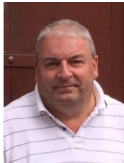
😞 HARRY 😞