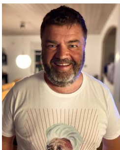
😞 BORRIS 😞

😊 STOKE fra øverste halvdel af Ligaens bedste række, lå langt under stregen inden den sidste afgørende kamp mod ZICO der lå over stregen. STOKE fik hevet sejren hjem og de øvrige resultater flaskede sig for STOKE , så dermed hoppede STOKE tre trin op til en placering over stregen og dermed var billetten til Semifinalerunden hjemme 😊