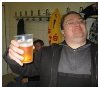
😞 LIONS 😞

😊 SELECT var længe sikker på mindst en 2. plads i puljen og selv om det blev til et nederlag i kampen mod MURER, så sluttede SELECT også over stregen i meget sikker stil og der var langt ned til nærmeste forfølger, så en velfortjent billet til Liga Cup'ens Semifinalerunde til SELECT 😊