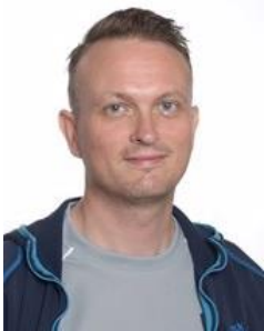
😞 COTTEE 😞

😊 FOX fra midten af Ligaens 2. division har en 3. plads i Liga Cup 2013 på CV'et og trods en placering under stregen havde FOX chancen lige til det sidste og det benyttede FOX sig af med en afsluttende sejr mod ANFIELD , så FOX hoppede efter fintælling over stregen og er nu klar til Semifinalerunden 😊