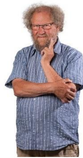
😞 STEAM 😞