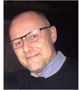
😞 NANDO 😞

😞 TYNDE fra den tynde ende af Ligaens bedste række, havde gode kort på hånden inden sidste runde, det krævede blot en afsluttende sejr mod UNITED, men det lykkedes ikke for TYNDE , der måtte indkassere et nederlag og dermed dumpede TYNDE lige nøjagtig ned under strengen og TYNDE er færdig i Liga Cup'en for den gang 😞 FAR fra nedre halvdel af den bedste Liga-række, havde også chancen lige til det sidste, men det afsluttende store nederlag mod NANDO ødelagde alle forhåbninger og FAR er ude af Liga Cup'en 😞 SCHØN fra nedre halvdel af Ligaens 3. division, blev faktisk Liga Cup Mester i 2020, men her i sæson 2024 var alle håb ude inden sidste kamp og SCHØN er færdig i Liga Cup'en for denne gang 😞 NANDO fra midten af 2. Liga, var udspillet totalt inden den sidste kamp, men NANDO pyntede trods alt lidt på stillingen med en afsluttende sejr mod FAR, men LIGA Cup spillet 2024 er forbi for NANDO 😞