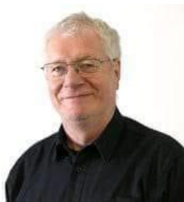
😞 ZICO 😞