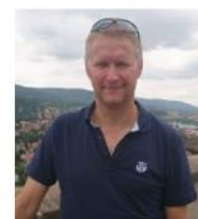
Kinks / Forest