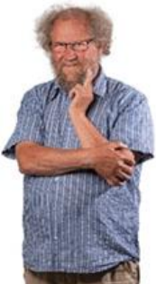
😊 STEAM 😊