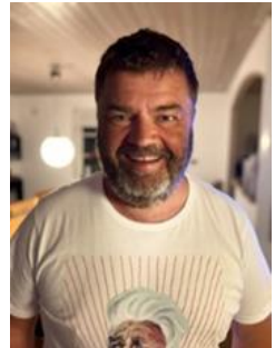
😊 BORRIS 😊