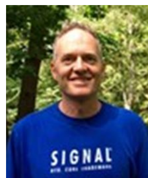
👤 ENYA 👤