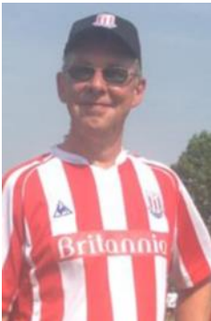
😊 STOKE 😊