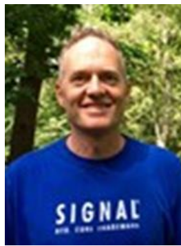
😊 MARSCHA 😊